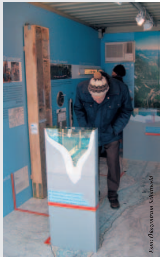
Genaueres Hinschauen lohnt sich.

Wer wissen will, wie das Grundwasser im Untergrund des Mittellands und in den Alpen aussieht, findet die Antwort