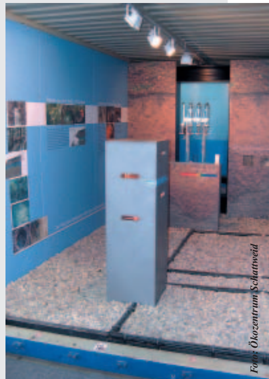
Der Wassertisch wartet auf Experimentierfreudige.