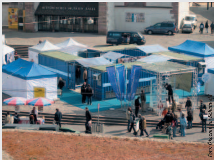
Die Grundwasser-Ausstellung im März 2003 in Basel