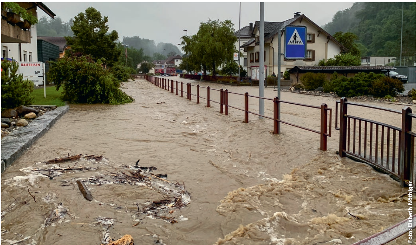
24. Juni 2021: Das erneute, wenn auch deutlich kleinere Hochwasser als 2017 hat gezeigt, dass die geplanten Hochwasserschutzmassnahmen notwendig sind.