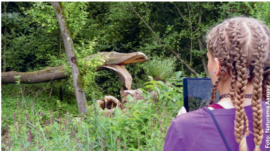
Eine Jugendliche auf dem Auen-Audiopfad fotografiert begeistert Biber Spuren, um diese auf den sozialen Medien zu verbreiten.

Mit neuen Audioguides können Familien, Schulklassen und Naturinteressierte die Welt der Auen entdecken. Alters- und stufengerecht führen die beiden Hauptcharaktere Nico und Nina die Besucherinnen und Besucher mit spannenden Hörtexten, Quizfragen und Onlinegeschichten entlang der Aare durch dynamische Uferlandschaften und durch das Naturwaldreservat im Rohrer Schachen. Alles, was man dazu braucht, ist ein Smartphone und einen QR-Code-Scanner.