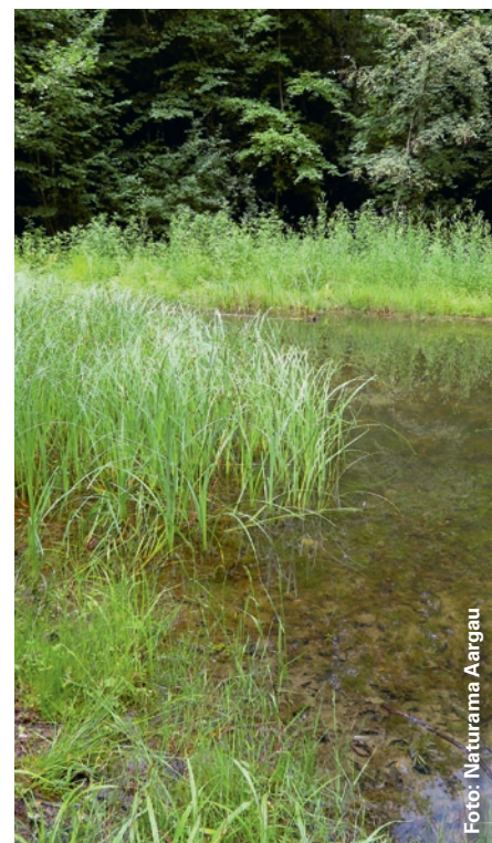
In einer Aue entstehen nach einer Überschwemmung Tümpel – zu sehen beim Posten 10 auf dem Auen-Audiopfad.

Der Auen-Audiopfad und der Auen-Rätselpfad sind entlang ihrer Strecken ausgeschildert. Über die QR-Codes erhält man interessante Informationen und spannende Geschichten.