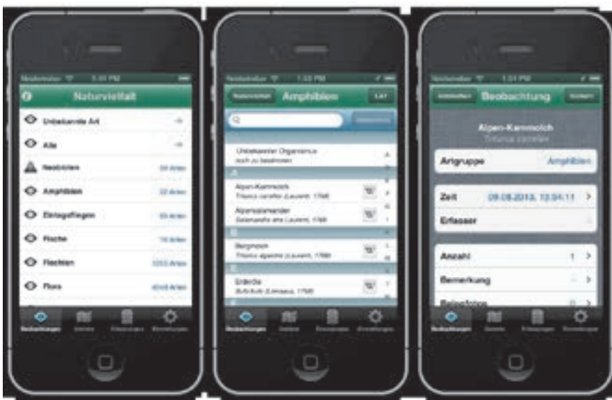
Ohne Stift und Papier: Feldarbeit leicht gemacht mit der iPhone-Applikation