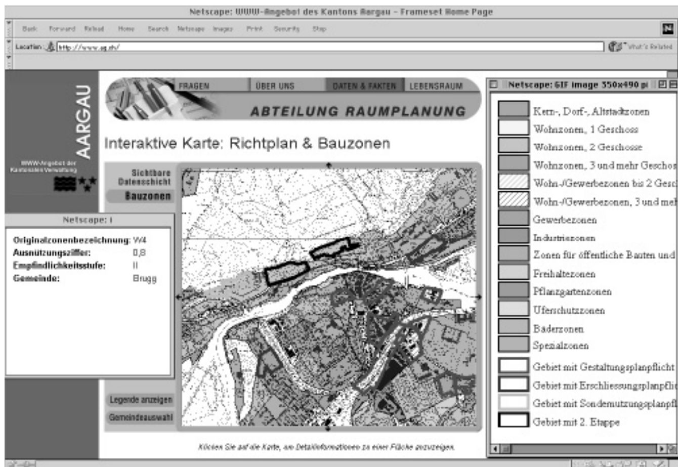
Abbildung 2: Auszug aus den Bauzonenplänen