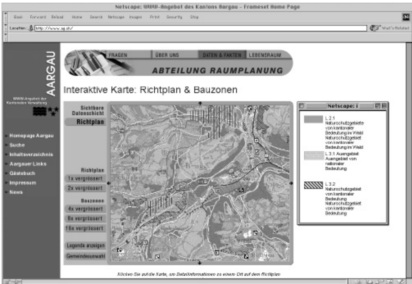
Abbildung 1: Ausschnitt aus der Richtplan-Gesamtkarte