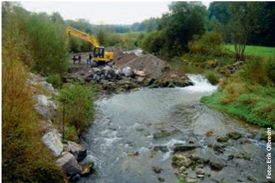
Zum Schutz von Abwasserleitungen wurde in der Bünzaue Möriken ein Blocksatz vorgelagert. Noch während den Bauarbeiten im Oktober 2012 verwischte ein Hochwasser bereits die Baggerspuren.

Auenböden ab: Kiesrücken, Sandlinien und Tonmulden werden von unterschiedlichen Pflanzengruppen besiedelt. Periodisch kommt es auch zu Neueinwanderungen. Schon nach 10 Jahren sind Orchideen aus der Gattung Ragwurz aufgetaucht, die schon früher für das Auengebiet um Aarau beschrieben wurden. Landseits der Hochwasserdämme bietet somit eine extensive Wiesennutzung Lebensraum auch für auentypische Arten, deren Primärlebensräume grösstenteils verschwunden sind. Artenreiche Wiesen sind wohl das beste Beispiel einer nachhaltigen Zusammenarbeit zwischen Landwirtschaft und Naturschutz – und Blumenwiesen gehören eben auch in den Auenschutzpark.