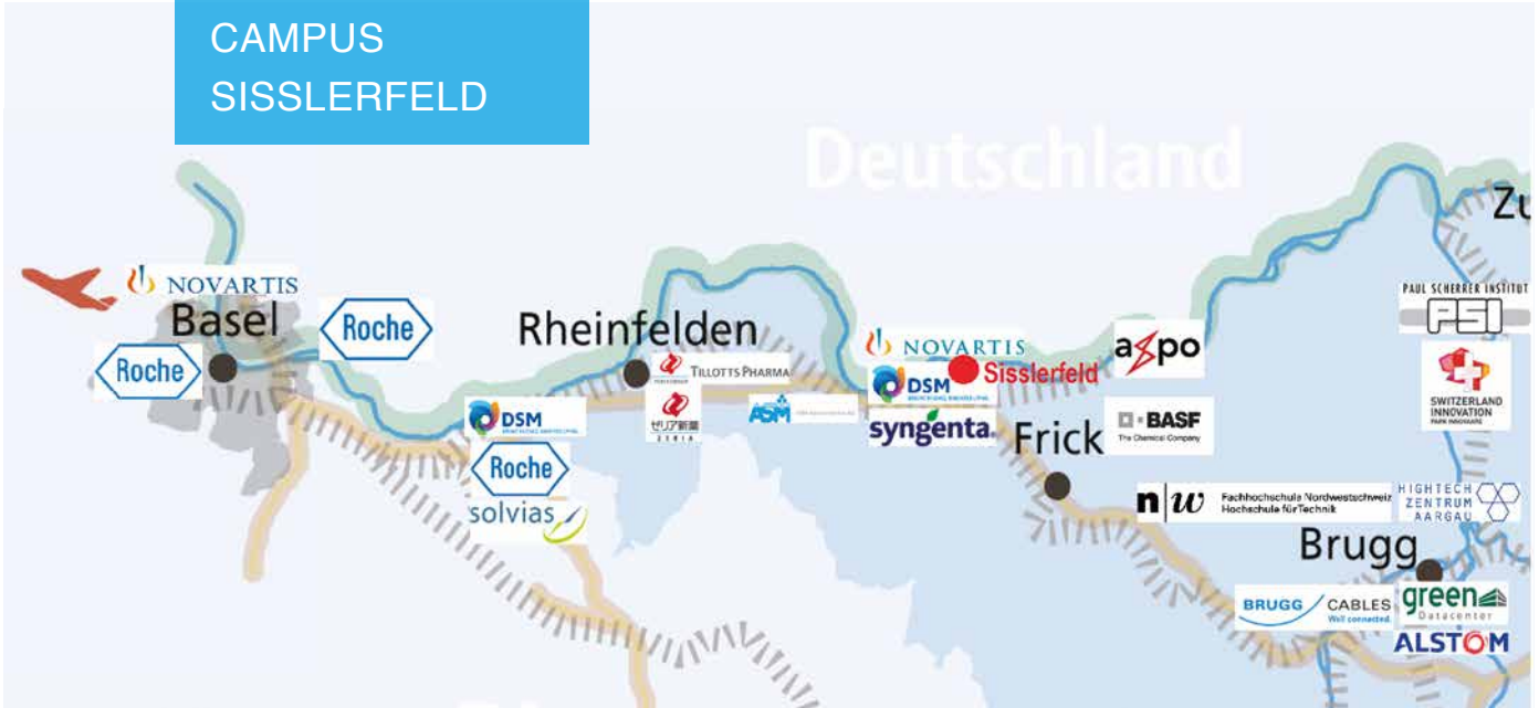
Der Life Sciences Cluster in der Region Basel und Fricktal

Der Life Sciences Campus Sisslerfeld ist Teil des Clusters von Wirtschaft und Forschung aus dem Bereich Life Sciences in der Region Fricktal.