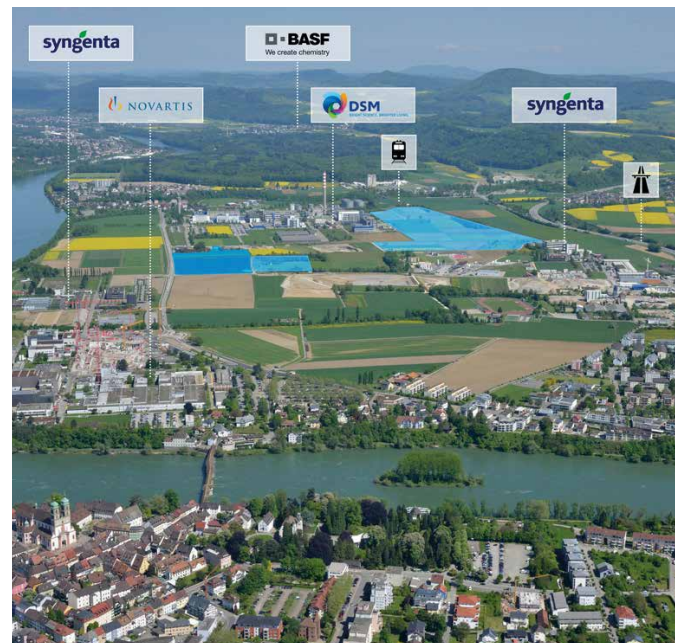
Der Life Sciences Campus Sisslerfeld ist umgeben von Syngenta, Novartis, DSM und BASF

Das attraktive Areal bietet mit insgesamt fast 300'000 m 2 Fläche grossen Gestaltungsspielraum. Teilflächen im nördlichen Teil sind möglich. Infrastruktur und Dienstleistungen umliegender Unternehmen aus dem Life Sciences Bereich können bei Bedarf genutzt werden. Dienstleistungsorientierte Behörden sorgen für kurze Entscheidungswege. Dank dem Hightech Zentrum Aargau (HTZ) profitieren Unternehmen im Sisslerfeld von Innovationsförderung, Unterstützung und Beratung.