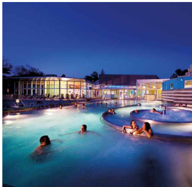
Solebad sole uno in Rheinfelden

Die Region rund um den neuen Life Sciences Campus Sisslerfeld verfügt über zahlreiche Kindertagesstätten sowie ein breites Spektrum an Bildungseinrichtungen. Die hervorragenden öffentlichen Schulen werden ergänzt durch internationale Schulen wie die International School in Rheinfelden. Mit den Universitätsstandorten Basel und Zürich, der ETH in Zürich und der Fachhochschule Nordwestschweiz (FHNW) bietet die Region hochrangige Aus- und Weiterbildungsmöglichkeiten. Daneben existiert mit dem dualen Bildungssystem, das praktische und schulische Ausbildung kombiniert, eine erstklassige Alternative zum akademischen Bildungsweg.