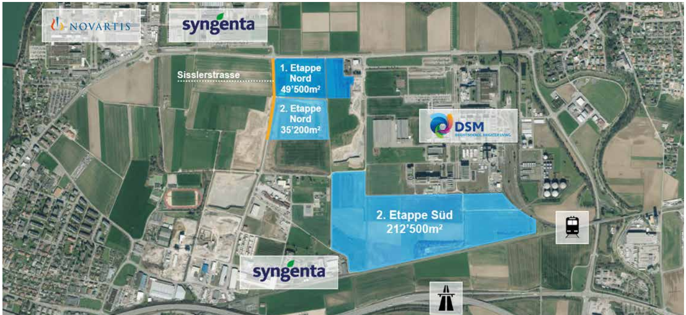
Etappenweise Entwicklung des Sisslerfelds

FAST 300'000 M 2 FLÄCHE FÜR IHRE ZUKUNFT