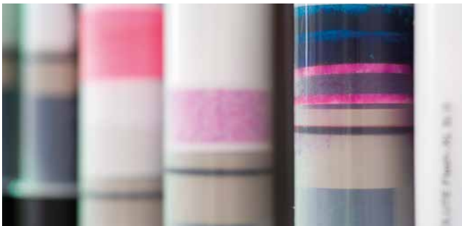
Chromatographie bei Syngenta in Stein