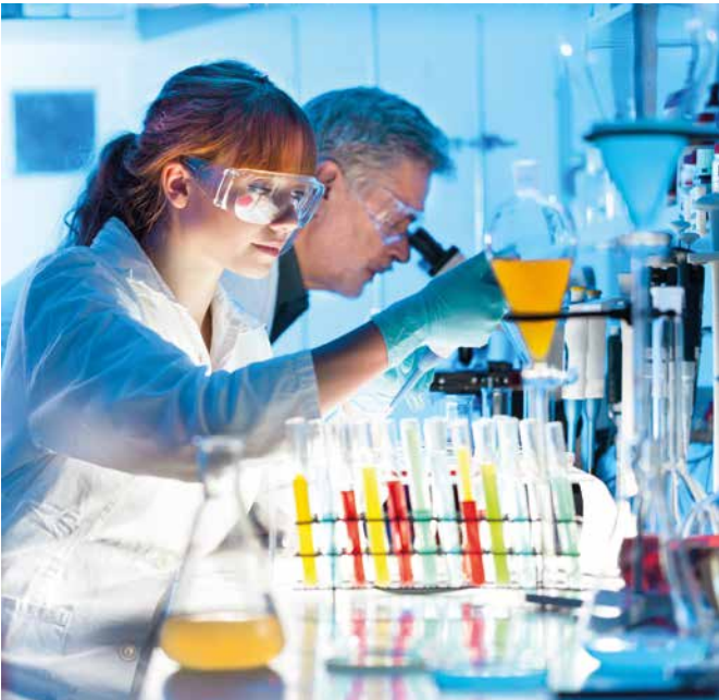
Der Life Sciences Cluster Basel zieht viele Fachkräfte an