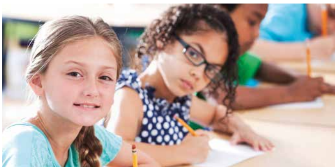
Internationale Schule in Rheinfelden