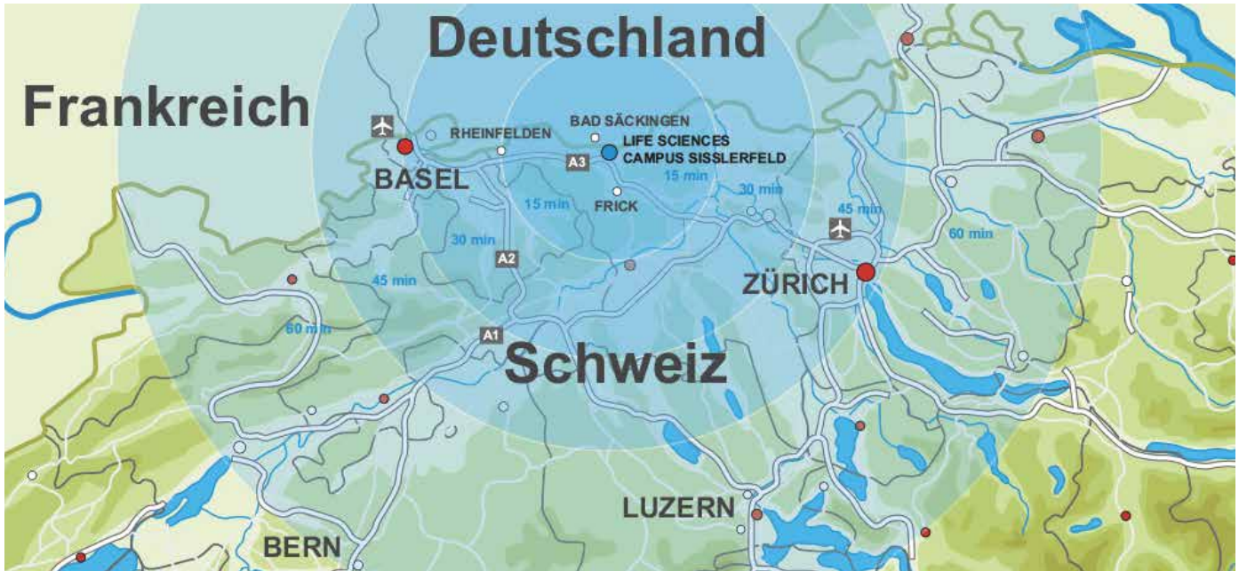
Der Life Sciences Campus Sisslerfeld liegt im Norden der Schweiz im Kanton Aargau

Der Life Sciences Campus Sisslerfeld liegt in der Schweiz im Kanton Aargau, der von Standard & Poor's wiederholt mit der Note «Triple A» ausgezeichnet wurde – denn hier finden Unternehmen ideale Bedingungen an hervorragenden Lagen.