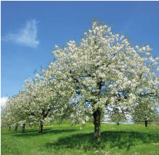
Frühling im Fricktal