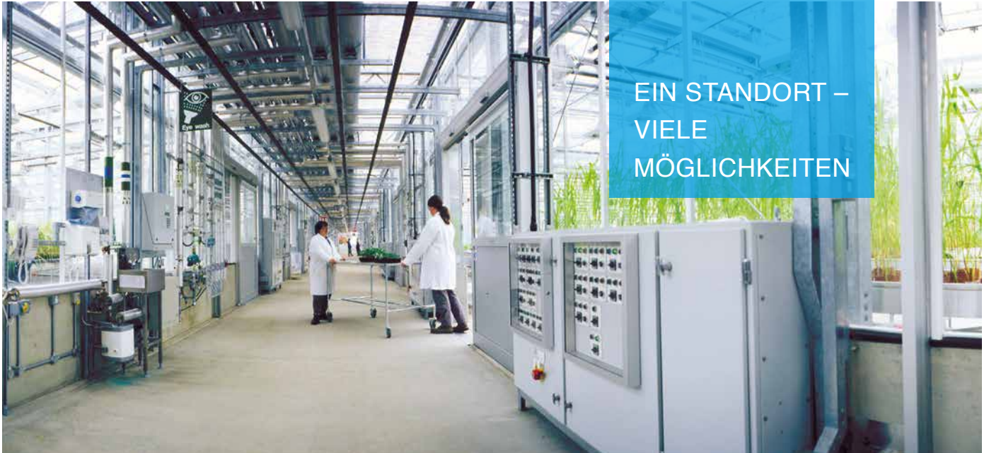
Gewächshaus von Syngenta in Stein

Das attraktive Areal ermöglicht Synergien mit Unternehmen aus dem direkten Umfeld wie Syngenta, DSM, Novartis oder BASF. Ob Produktion, Forschung oder Entwicklung: Der Life Sciences Campus Sisslerfeld bietet mit einer Gesamtfläche von fast 300'000 m 2 zahlreiche Möglichkeiten für Ihr Unternehmen.