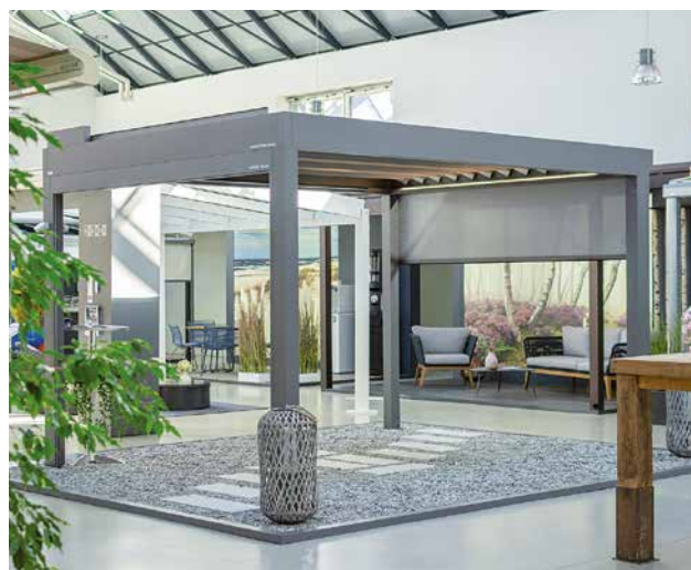
Die Ausstellungsräume der Stobag-Filiale in Muri. Ein solcher Pavillon soll mit dem Konfigurator perfekt visualisiert werden können.

Eine der grössten Herausforderungen stellt die Implementierung des Konfigurators in den Webshop dar. Gerade bei der Datendurchgängigkeit stellt man fest, dass der Konfigurator seiner Zeit relativ weit voraus ist. Die Technik für die Implementation ist noch nicht so weit entwickelt, dass ein reibungsloser Datenfluss gewährleistet werden kann. Es stellt sich die Frage, wie sich der Konfigurator stabil betreiben lässt. Eine weitere Herausforderung ist, den Mitarbeitenden die neue Arbeitsweise näher zu bringen. Bisher wird mit gedruckten Bestellformularen gearbeitet, die ausgefüllt werden müssen. Diese bestehen aus bis zu 20 Seiten. Das macht es nicht möglich, effizient zu arbeiten. Nun müssen sich die Mitarbeitenden auf die neue digitale Vorgehensweise einlassen. Daniel Fiechter ist davon überzeugt, dass diese Umstellung