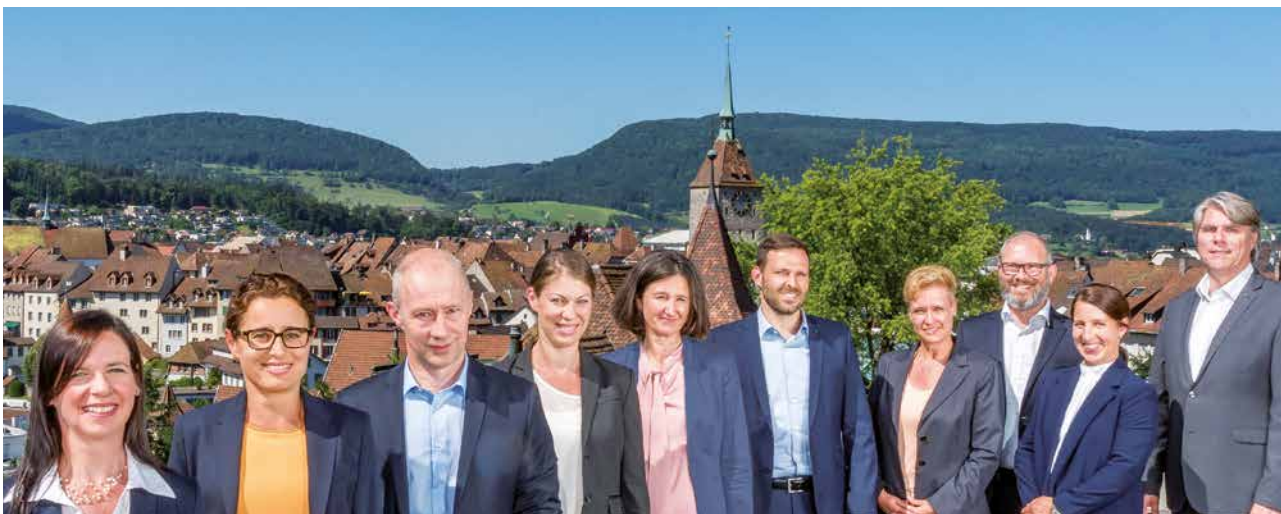
Das Team von Aargau Services Standortförderung unterstützt Unternehmen bei Standortfragen, Firmengründungen oder Finanzierungsmöglichkeiten.

innovativen Produktes: Die Hochschule für Technik FHNW bietet Ihnen unkomplizierte Unterstützung. Die Technologietransferstelle FITT wird gemeinsam von der Fachhochschule Nordwestschweiz (FHNW) und der Aargauischen Industrie- und Handelskammer betrieben. Das Wissen der Fachhochschule soll den Unternehmen einfach zugänglich gemacht werden, FITT öffnet die passenden Türen zu Personen, Teams und Lösungen.