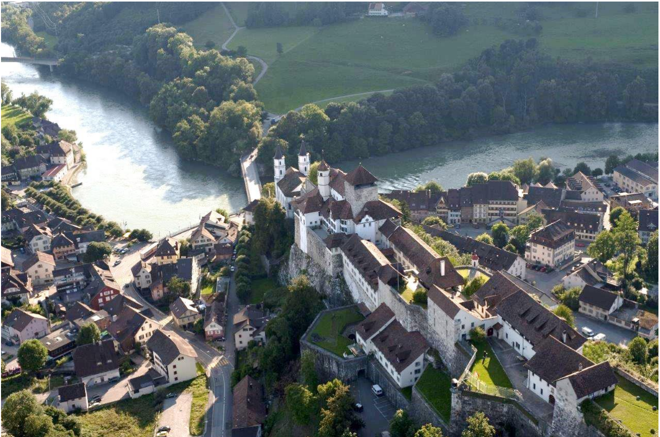
Festung Aarburg aus der Vogelperspektive