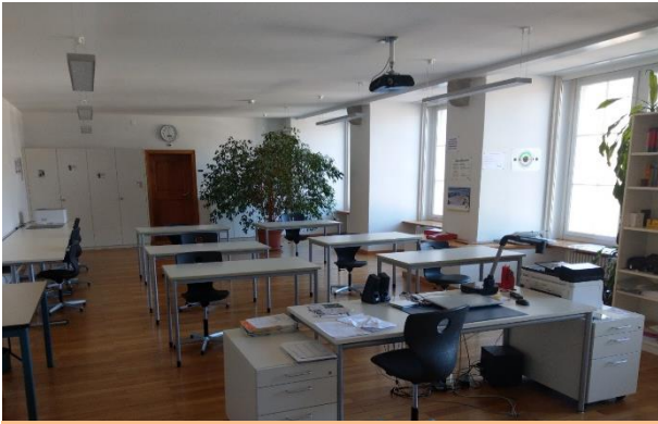
2019: Neu Schulzimmer SBG (Pallas Gebäude)

Genügt es, einfach die Berufsschule intern zu führen – sind damit die Probleme gelöst?