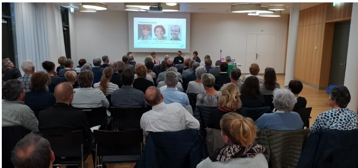
Podiumsdiskussion an der Herbstversammlung 2019

Die Moderatorin eröffnete die Podiumsdiskussion mit der Frage nach der Bedeutung der demographischen Alterung in den eigenen Wohngemeinden.