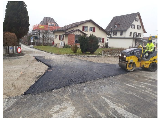
Abb. 4: Einbau Sauberkeitsschicht Zu-/ und Ausfahrten Querstrassen