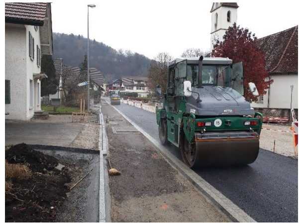
Abb. 2: Walzen der eingebauten Asphalttragschicht in der Fahrspur