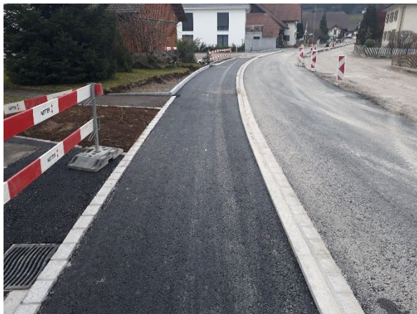
Abb. 3: Eingebaute Asphalttragschicht Gehweg