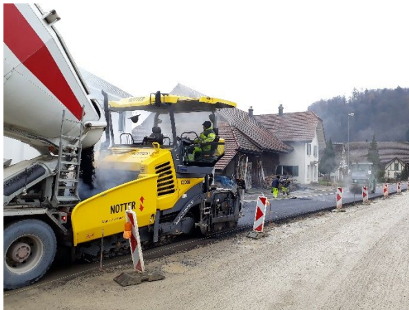
Abb. 1: Einbau Asphalttragschicht Fahrspur Richtung Staufen