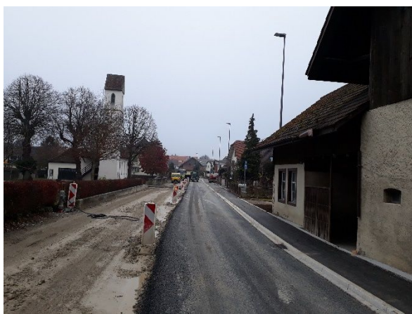
Abb. 5: Phasenumstellung innerhalb Bauphase 3 von Süd nach Nord inkl. neu aufgestellter Kandela-ber