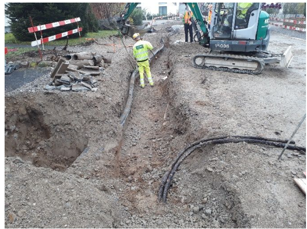
Abb. 2: Grabenaushub für Verkleitungen Elektro + ATB-Medienrohr