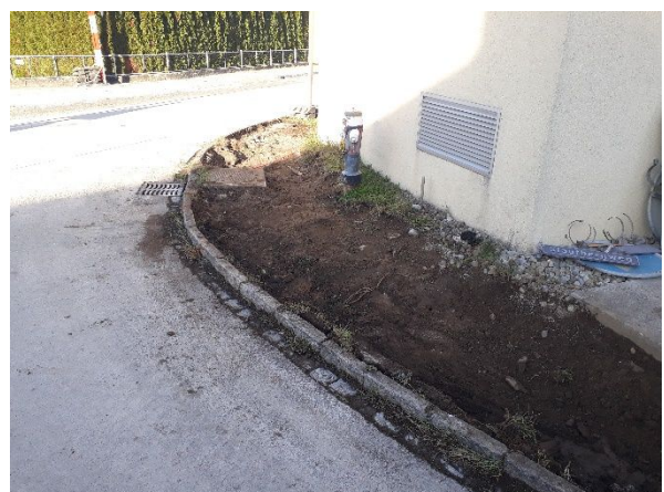
Abb. 6: Abhumusieren Rabatte Trafostation Ausserdorf