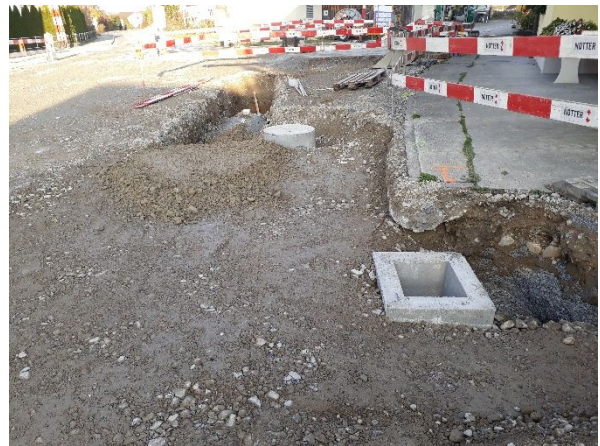
Abb. 4: Versetzen Entwässerungsschächte Schluck + Strassenablauf