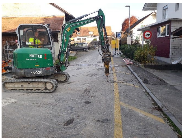
Abb. 5: Freilegen best. EW-Schacht Staufbergweg