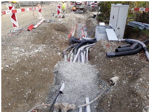
Abb. 3: Anschluss und Versetzen EW-Verteilkabine