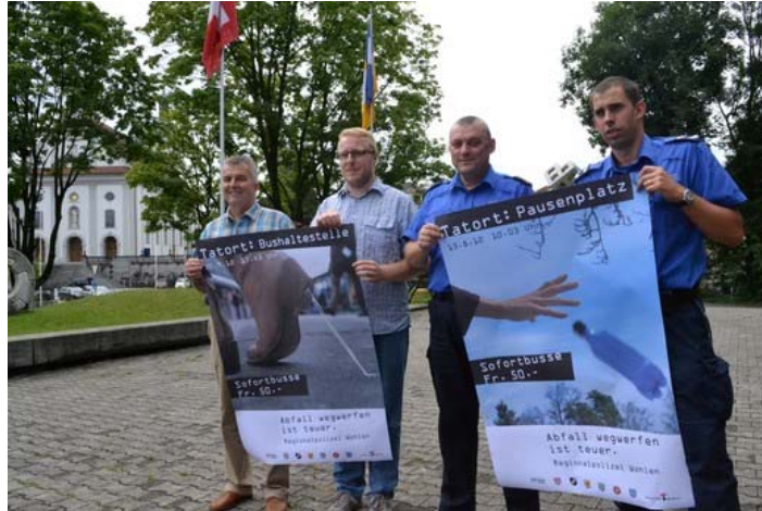
Departement Bau, Verkehr und Umwelt - Littering im Kanton Aargau - Juli 2013