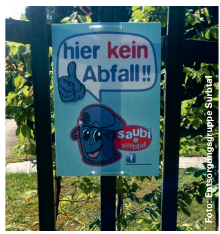
Private können mit diesen Plakaten darauf aufmerksam machen, dass ihr Garten kein Abfallkübel ist.