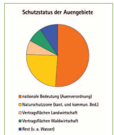
Schutzstatus der Auengebiete im «Auenschutzpark Aargau».