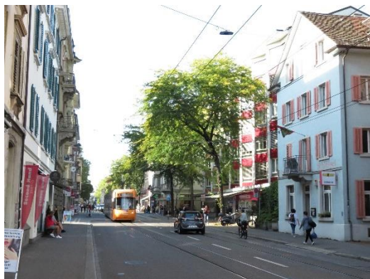
Abbildung 4: Das Tram im belebten Zentrumsbereich – Beispiel aus dem Zürcher Seefeld

Die nun im Zwischenergebnis vorgesehene Linienführung führt vom Bahnhof Killwangen entlang der Kantonsstrasse zum Zentrum Neuenhof, unterquert die SBB-Linie an der Limmatstrasse, wo sie parallel zur bestehenden Autobahnbrücke die Limmat überquert. Von dort unterquert sie die Autobahn und Furtal-Linie der SBB und sucht den Anschluss in Kombination mit einer neuen Haltestelle LTB/SBB in Wettingen Tägerhard. Für die Weiterführung ist der Anschluss an die Landstrasse zu suchen. Von dort soll das Tram über die Hochbrücke durch den Schlossbergtunnel und zum Bahnhof Baden (Westseite) geführt werden.