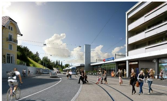
Abbildung 1: Visualisierung Bahnhofplatz Killwangen mit Limmattalbahn

Die Rückmeldungen aus der öffentlichen Anhörung waren bereits grösstenteils positiv gewesen, das hat der Grosse Rat nun bestätigt: Am 8. September 2020 hat er mit deutlichem Mehr die neue Tramstrecke der Limmattalbahn (LTB) von Killwangen nach Baden als Zwischenergebnis in den kantonalen Richtplan aufgenommen. In den nächsten Monaten werden gemeinsam mit den betroffenen Gemeinden die Details der Tramstrecke und verschiedene offene Fragen aus der Anhörung bereinigt. Der nächste Verfahrensschritt ist die Festsetzung der Linienführung im Richtplan.