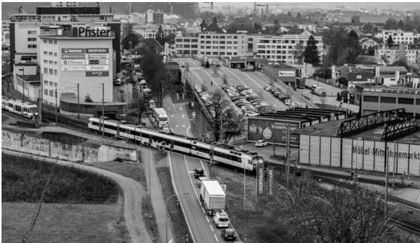
Der Verkehr auf der Bernstrasse Ost (K235) staut sich bei geschlossener Barriere beim Bahnübergang Pfister (Dezember 2025).

Zwei SBB-Bahnübergänge beeinträchtigen bereits heute den Verkehrsfluss auf den Ortsdurchfahrten. Das Angebot auf der Bahnlinie Lenzburg–Suhr–Zofingen wird für den Personen- und Güterverkehr ausgebaut, was künftig zu noch mehr Barriere-Schliessungen führt. Beim Bahnübergang Rundhaus in Suhr rechnen die SBB zukünftig pro Tag mit Schliesszeiten von etwa 4 Stunden und 10 Minuten und beim Bahnübergang Pfister von etwa 6 Stunden und 40 Minuten.