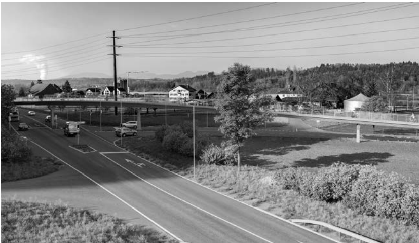
Visualisierung: Grünstreifen mit Gehölzen und Büschen entlang der Neuen Kantonsstrasse NK240 und im Hintergrund die neue Fuss- und Velobrücke B-8101.

Ergänzende Massnahmen, wie etwa Kleintierdurchlässe und ein begrünter Streifen auf der neuen Überführung Langmattweg, tragen zusätzlich zur ökologischen Aufwertung bei.