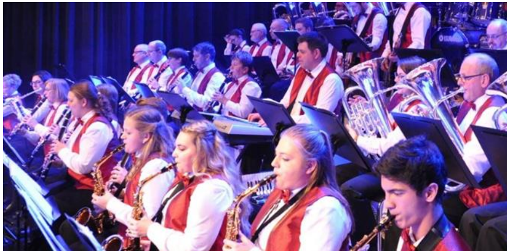
Abbildung 1: Musikgesellschaft Muhlen (MGM) in Aktion.