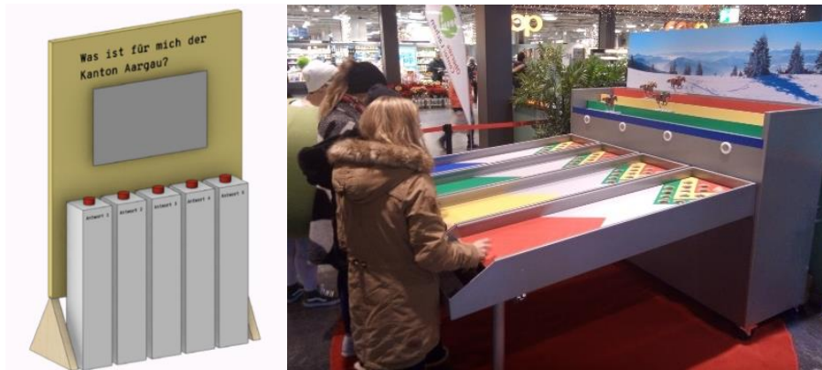
Abbildung 1: Abstimmungswand beim Eingang (links) und Pferderennen-Spiel beim Ausgang der Allée marchande (rechts).

Die Allée marchande ist an allen drei Festtagen geöffnet (12.–14. August 2022). Das Konzept sieht vor, dass die Besuchenden mit ihren eigenen Vorstellungen über den Kanton Aargau konfrontiert werden. So bildet der Einstieg in die Ausstellung eine Abstimmungswand mit der Frage, was für die Besucherinnen und Besucher "typisch Aargau" ist (vgl. Abbildung 1). Mit den sechs Informationsmodulen "Moderne Landwirtschaft", "Forschung, Bildung und Hightech", "Lebendige Brauchtümer", "Historie und kulturelles Erbe", "Sport, Freizeit, Wasser" und "Wellness und Gesundheit" wird die Einstiegsfrage aufgenommen und präsentiert, was der Kanton Aargau zu bieten hat. Die wesentlichen Elemente der Informationsmodule bilden jeweils ein Kurzfilm, eine Infowand und ein Sitzelement.