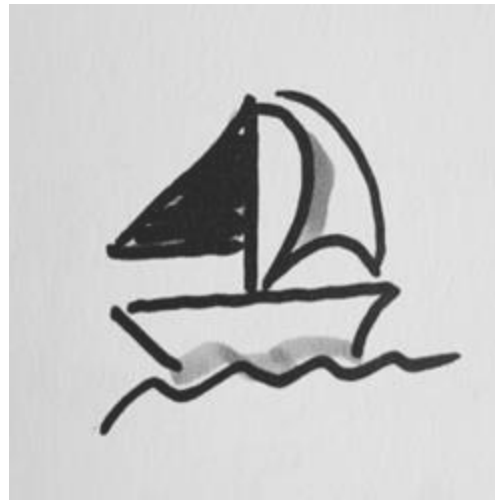
BILDUNGSZIELE – GEMEINSAME VERANTWORTUNG