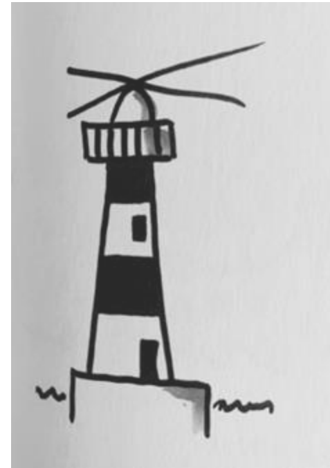
ZIEL/OUTCOME – ÜKs – BERUFLICHER ERFOLG – TEILHABE AN DER GESELLSCHAFT