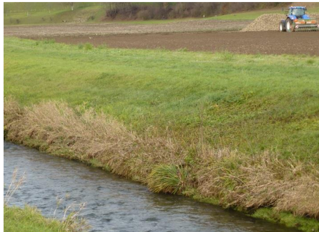
Extensiv genutzte Wiese entlang der Bünz.

darf bezüglich Ausdehnung der Gewässerräume aktuell und detailliert aufzeigt.