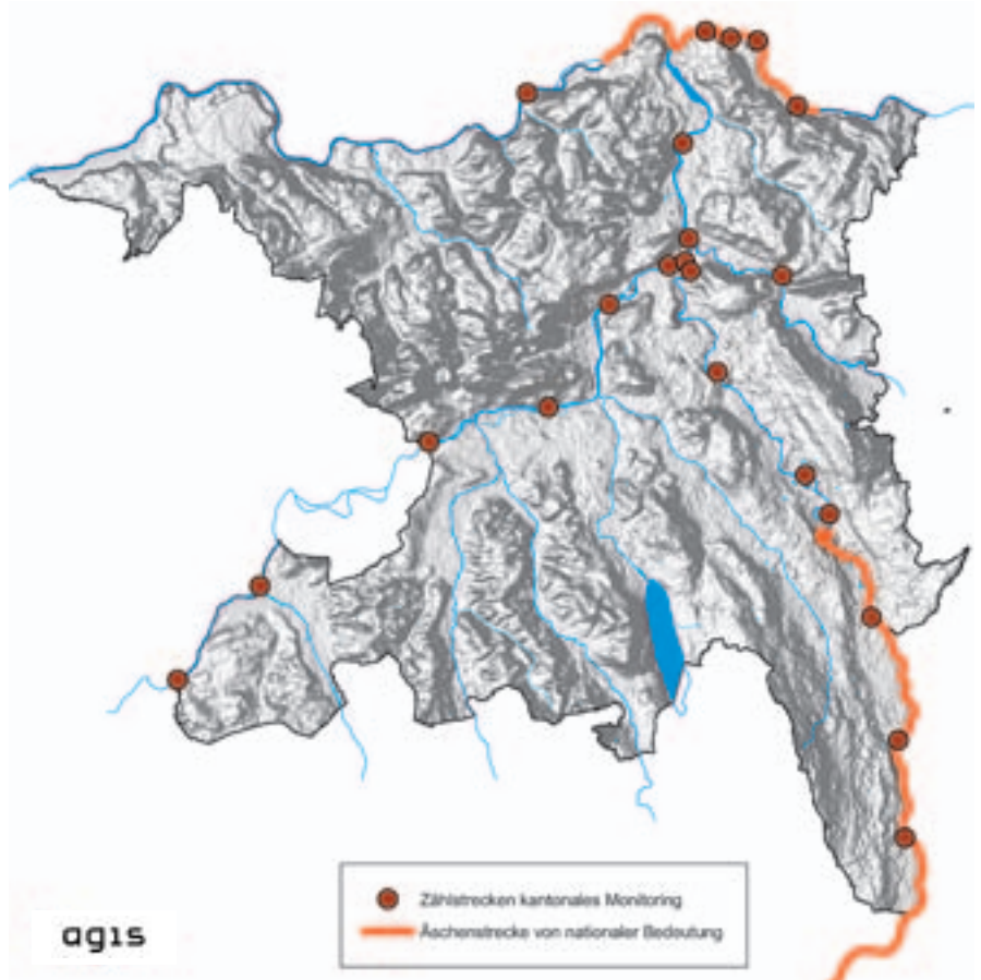
Die Zählstrecken sind in den vier grossen Flüssen über den ganzen Kanton verteilt.

Die Auswahl der Zählstrecken geschah in Zusammenarbeit mit dem kantonalen Fischereiverband, Fachspezialisten und den Fischern. Wichtig dabei war, dass Strecken, die bereits mehrmals erhoben wurden, weiterhin untersucht werden, um lange und bestehende Datenreihen weiterzuführen. Die beiden Äschenstrecken von nationaler Bedeutung im Kanton Aargau gehören ebenfalls dazu. Mit dem Monitoring werden nicht nur die jungen Äschen gezählt. Entlang der Zählstrecken wird auch die Struktur des Ufers aufgenommen, um zu erfassen, wie viele der möglichen