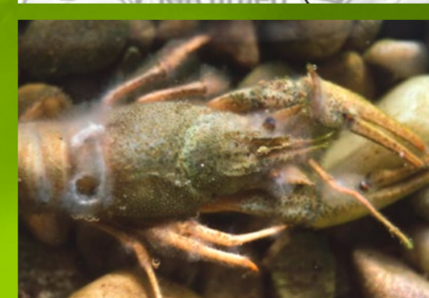
Krebs mit Krebspest