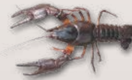
Edelkreb Astacus astacus

Bewohnt die Uferzonen grösserer Fliessgewässer sowie Weiher und Seen mit gutem Unterschlupfangebot.