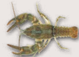
Steinkrebs Austropotamobius torrentium

Naturnahe, strukturreiche, kühle und unverschmutzte Bäche werden als Lebensraum bevorzugt.