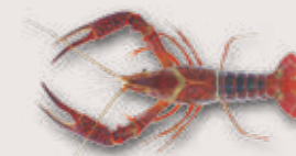
Roter Amerikanischer Sumpfkreb Procambarus clarkii

Kommt in fliessenden und stehenden Gewässern vor und ist widerstandsfähig gegenüber Umwelteinflüssen. Sein ausgesprochener Wandertrieb führt ihn dazu, auch grössere Distanzen an Land zurückzulegen. Stammt ursprünglich aus dem Süden von Nordamerika.