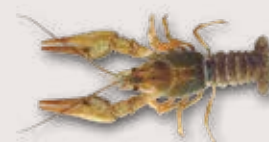
Galizischer Sumpfkreb Astacus leptodactylus

Bewohnt vorwiegend Seen und Teiche. Erträgt höhere Temperaturen und niedrigere Sauerstoffgehalte des Wassers als die einheimischen Krebse. Wurde als Speisekreb aus Südosteuropa in die Schweiz importiert.