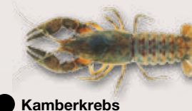
Kamberkreb Orconectes limosus

Bewohnt Ufer langsam fliessender und stehender Gewässer. Sehr widerstandsfähig gegenüber Umwelteinflüssen. Er lebt auch in verschmutzten und strukturarmen Gewässern. Stammt ursprünglich aus Nordamerika.