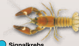
Signalkreb Pacifastacus leniusculus

Bewohnt Uferzonen stehender und fliessender Gewässer. Ähnelt dem einheimischen Edelkreb. Stammt ursprünglich von der Westküste Nordamerikas.