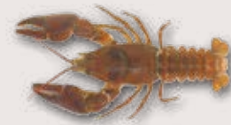
Dohlenkreb Austropotamobius pallipes

Bewohnt strukturreiche, eher kühle und unverschmutzte Fliessgewässer.