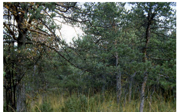
Pfeifengras-Föhrenwälder auf mergelreichen Hanglagen