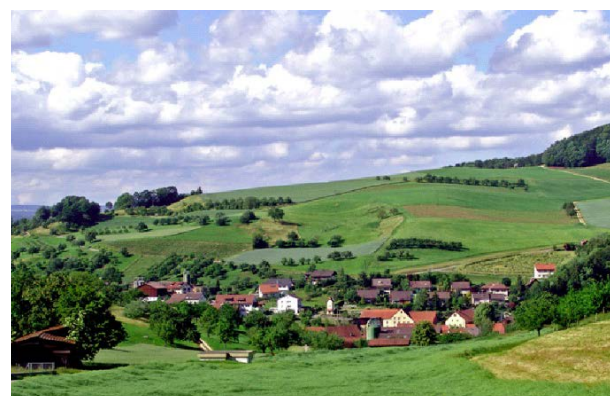
National bedeutendes Ortsbild Ittenthal