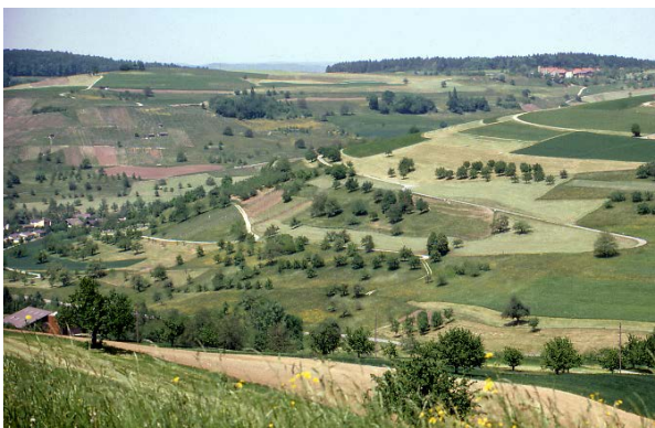
Mosaik von Rebbergen, Obstgärten, Hecken, Wiesen und Äckern bei Wil