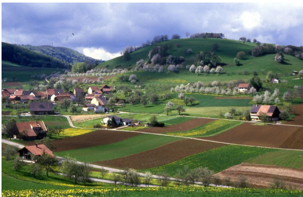
In Talmulde eingebettetes Mandach