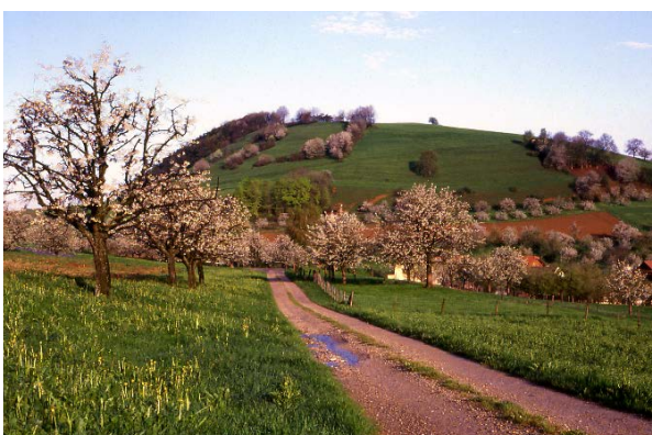
Landschaftsprägende Hochstammobstbäume bei Mandach