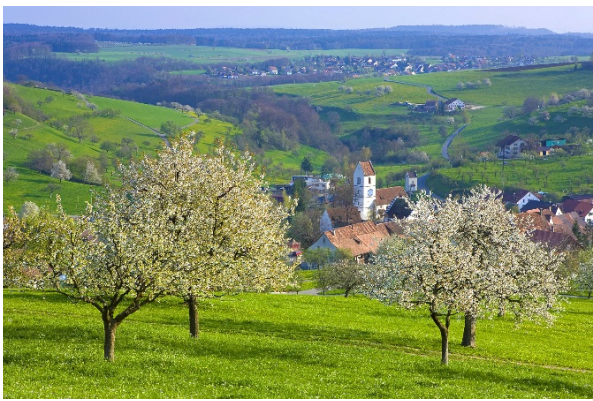
Hochstammobstbäume oberhalb von Oltingen