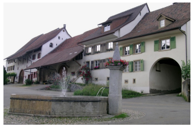
Dreisässenhäuser am Dorfplatz von Wenslingen