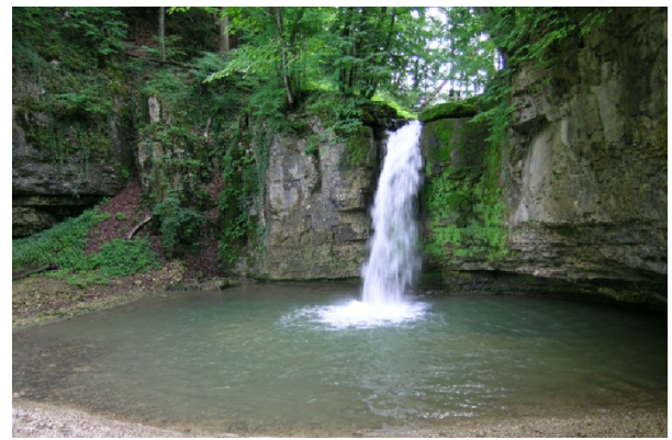
Schichtstufe mit «Giessen» im Eital