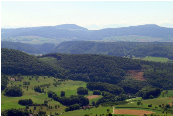
Eital in der Mitte, Faltenjura im Hintergrund