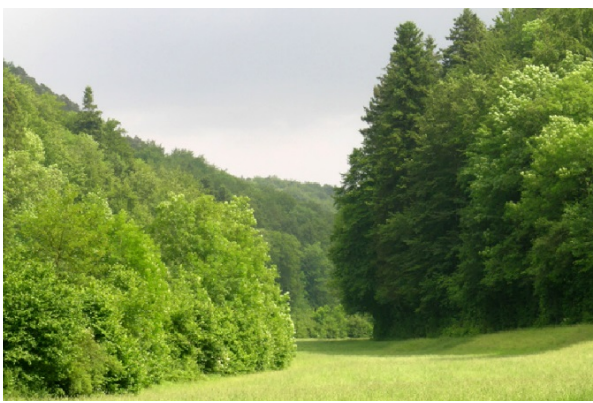
Sohlenkerbtal des Chrintelbachs