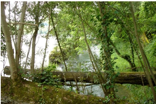
Steilufer bei der Buhalde