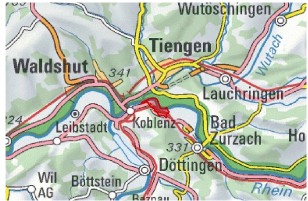
BLN 1103 Koblenzer Laufen