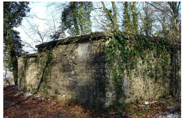
Ruine des römischen Wachturms «summa rapida»