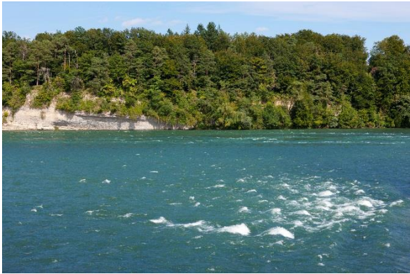
Stromschnelle Koblenzer Laufen