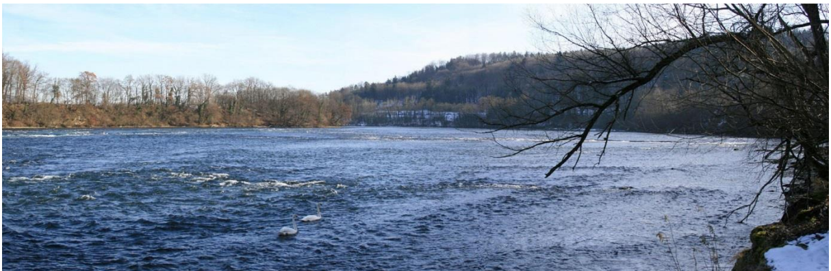
Der Koblenzer Laufen