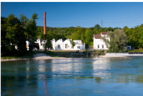
Industrieanlagen bei Stroppel