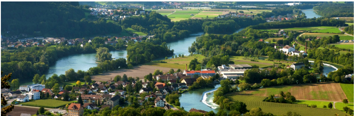
Zusammenfluss von Aare und Limmat bei Lauffohr