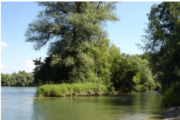
Aarelandschaft bei Stroppel