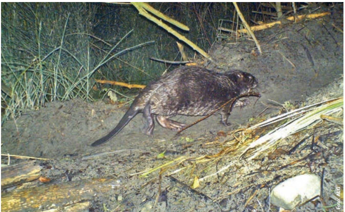
Ein Biber bei der Arbeit.

Im Winter 2013 sind erneut sämtliche Gewässer mit derselben Methode nach Biberspuren abgesucht worden. Insgesamt wurden 46 Familienreviere und 31 Einzel- oder Paarreviere festgestellt, was erneut einem Be-