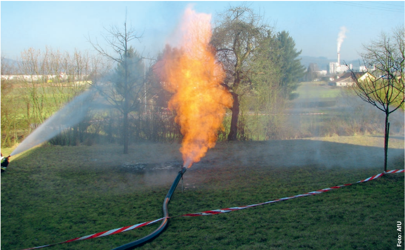
Am 14. Februar 2008 kam es in Rothrist beim Abteufen einer Erdwärmesondenbohrung zu starken Gasaustritten, die während Stunden brannten.