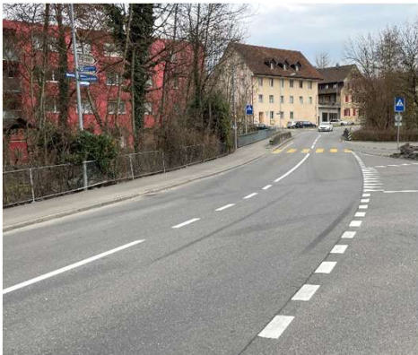
Abb. 3: Knoten Unterdorfstrasse / Egliswilerstrasse