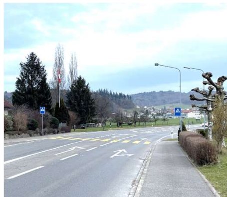
Abb. 4: Knoten Lindenweg / Birackerstrasse