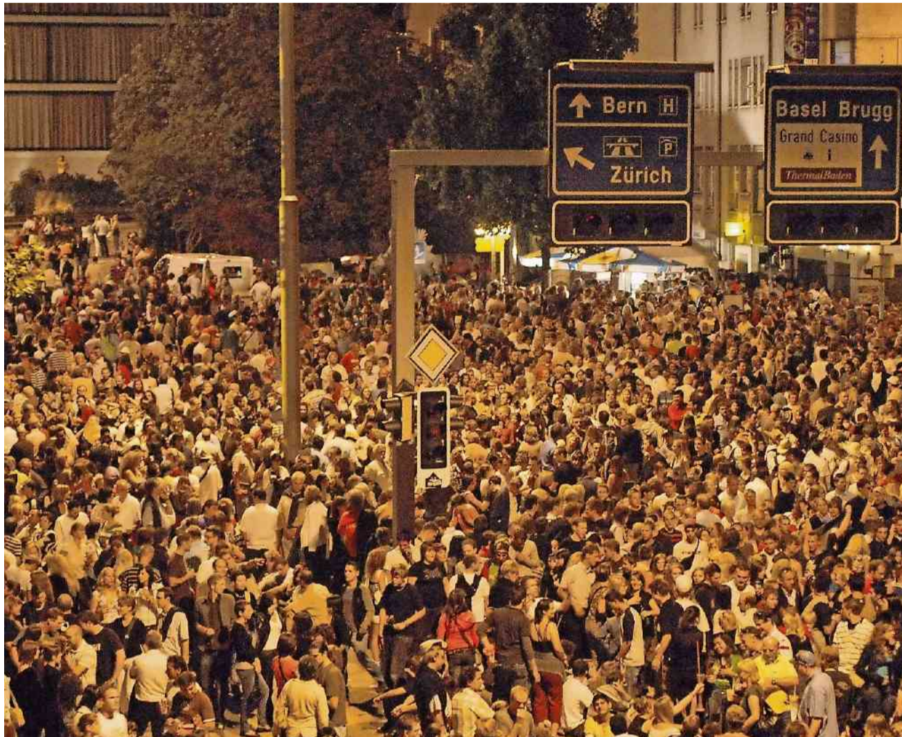
Hunderttausend Besucher jeden Abend – wie 2007 wird die Badenfahrt auch dieses Jahr Menschenmassen anlocken.

Von den täglich rund 100 000 Gästen könnten nicht alle kontrolliert werden, sagt der stellvertretende Polizeichef weiter. «Denn an der Badenfahrt gibt es keine offiziellen Eingänge, und wir können nicht die ganze Stadt abriegeln.