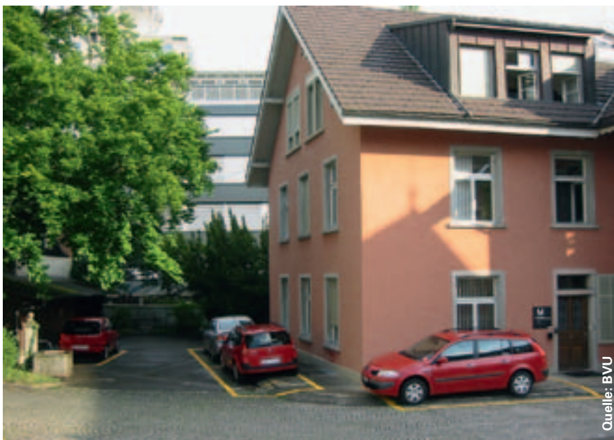
Vier Mobility-Fahrzeuge sind vor dem BVU-Verwaltungsgebäude Buchenhof in Aarau stationiert.

rationsvertrag mit der Firma Mobility CarSharing Schweiz. Dadurch erhielten vor allem die Mitarbeitenden der Zentralverwaltung die Möglichkeit, sowohl Dienstfahrten als auch private Fahrten mit den roten Mobility-Autos zu unternehmen. So waren sie weniger auf das eigene Auto angewiesen, nutzten für den Arbeitsweg vermehrt den öffentlichen Verkehr, das Velo oder waren zu Fuss unterwegs. Der eigens eingerichtete Standort von Mobility-Fahrzeugen direkt vor dem Verwaltungsgebäude des BVU in Aarau ermöglicht bis heute eine unkomplizierte Nutzung.