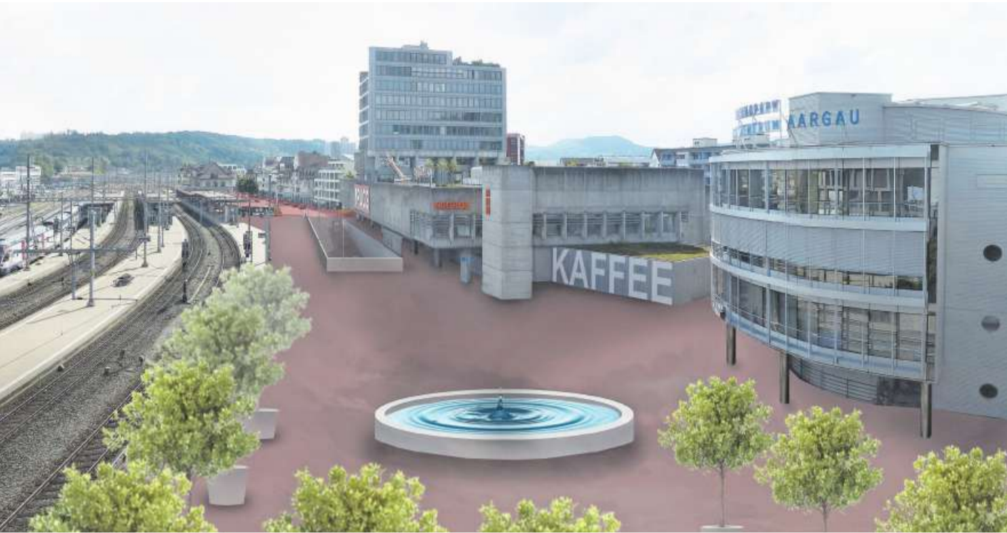
nen Bahnhof, Einkaufszentrum und Hightech Zentrum nach der Zentrumsentlastung dereinst aussehen.