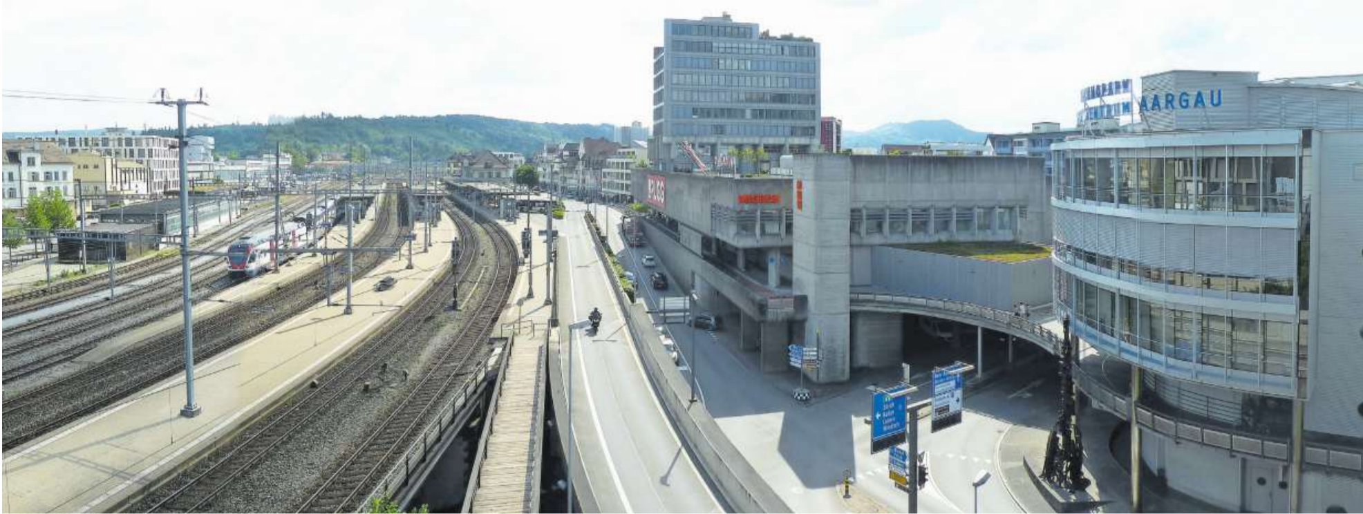
So stellt sich die Situation im Zentrum der Stadt Brugg beim Bahnhof heute dar.