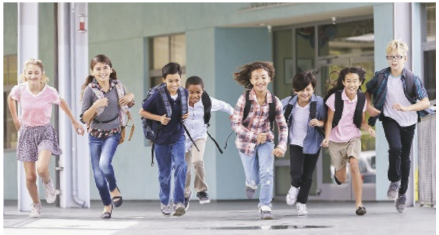
Der SPD bietet auch künftig eine qualitativ hochstehende Beratung für Schulen und Familien an.

«Wie bis anhin unterstützt und berät der SPD die Schulen in der Schulung von Kindern und Jugendlichen mit Lern- und Verhaltensschwierigkeiten oder mit einer Behinderung in der Regelklasse. Eine zentrale Änderung ist, dass der SPD neu keine Ressourcen beziehungsweise Lektionen mehr sprechen muss. Dadurch können wir uns auf die Abklärungsarbeit bei Verdacht auf Behinderung fokussieren: Welche Entwicklungs- und Bildungsziele können die betroffenen Schülerinnen und Schüler erreichen? Wie können sie wirkungsvoll unterrichtet werden? Unsere Beurteilungen halten wir in einem