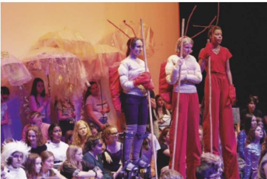
Der Wettbewerb Funkenflug fördert auf vielfältige Weise die kreative Entwicklung der Schülerinnen und Schüler. Auf dem Bild zu sehen: Funkenflieger 2019 Aquata, Oberstufe Unteres Aaretal.

Die Anmeldung erfolgt über das digitale Formular auf dem Onlineportal von «Kultur macht Schule». Projekte können bis am Sonntag, 26. April 2020 eingegeben werden.