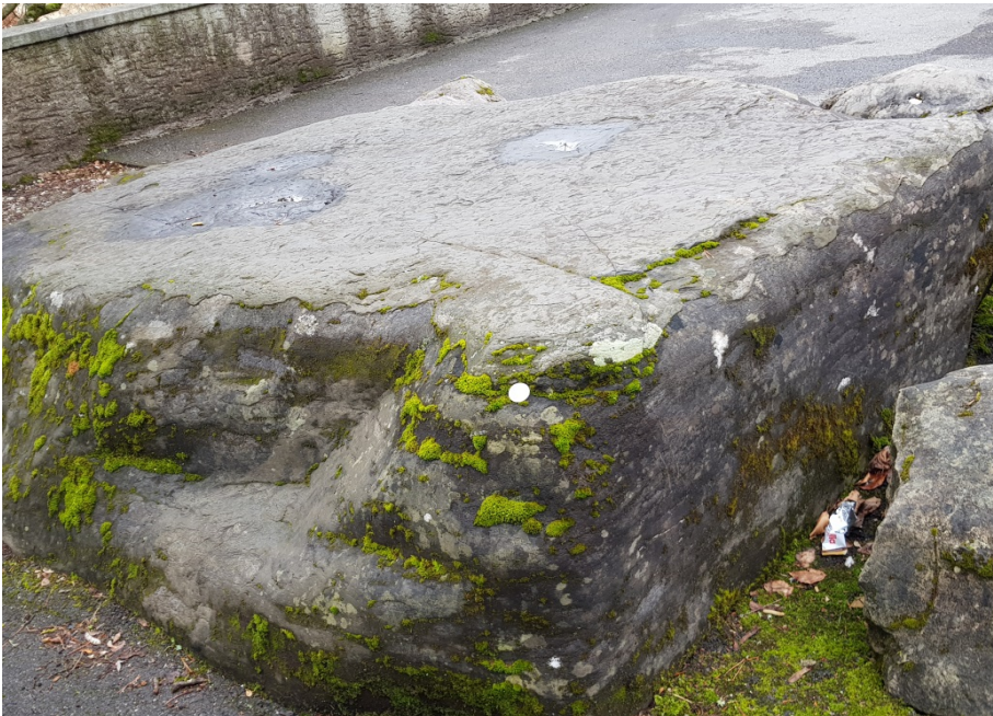
Nahaufnahme des Sandsteinfindlings