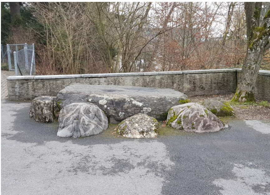
Der Boluston umrandet von Nagelfluhblöcken mit Blick Richtung Norden

Am Anfang glaubte man, dass der Findling von auswärts an die Fundstelle transportiert wurde, so überzeugte man sich davon, dass er tatsächlich vom Burghaldenareal selbst stammt. Bald nach Freilegung grub nämlich in nächster Nähe hunderte von kleineren und grösseren erratischen Blöcken aus. Die meisten wurden gesprengt und zerschlagen, nur einige markante Vertreter dem Erstgefundenen zur Seite gelegt und so eine interessante Steingruppe auf dem Pausenplatz geschaffen.