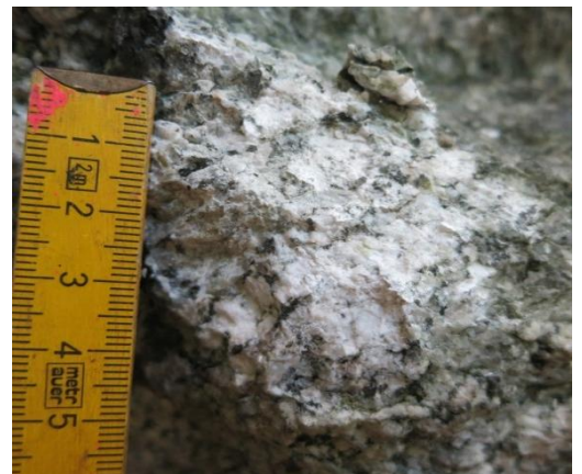
Frische Bruchfläche des Findlings