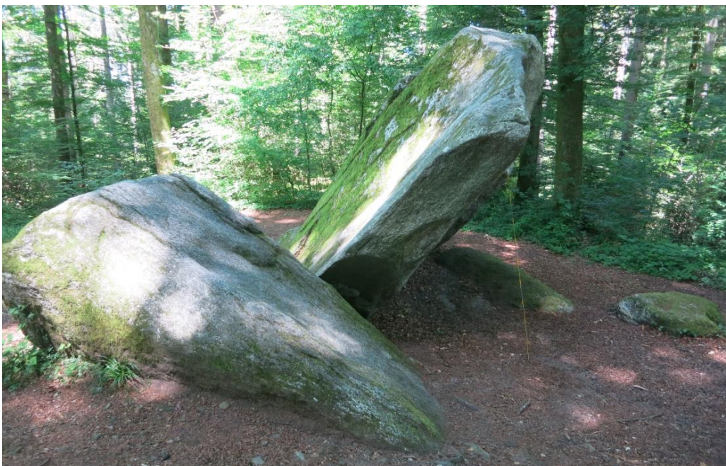
Der Bettlerstein (schräggestellte Felsplatte) mit den umgebenden Granit-Findlingen, Blick Richtung Nordwesten (Massstab 2 m)

Der Findling wurde vom Reussgletscher nach dessen Rückzug während der letzten Eiszeit, der Birrfeld-Eiszeit (ehemals Würmeiszeit) in diesem Gebiet zurückgelassen.