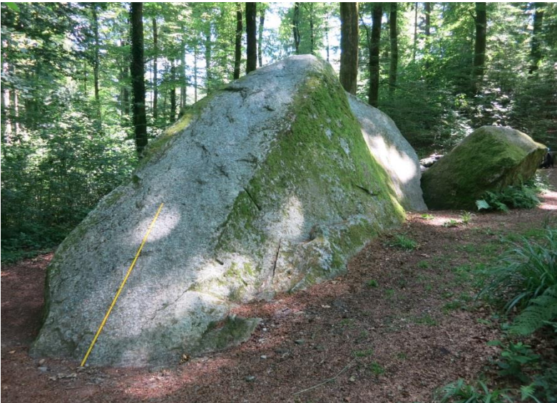
Der Bettlerstein mit Blick Richtung Osten (Massstab 2 m)