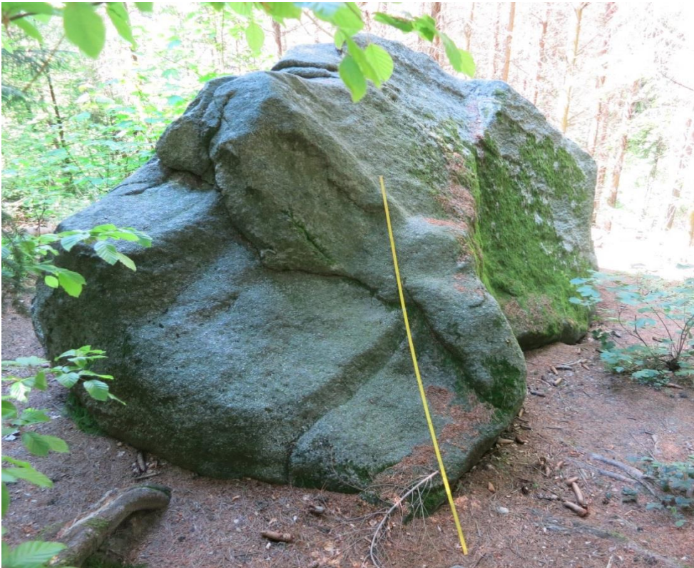
Elefantenstein mit Blick Richtung Westen (Massstab 2 m)