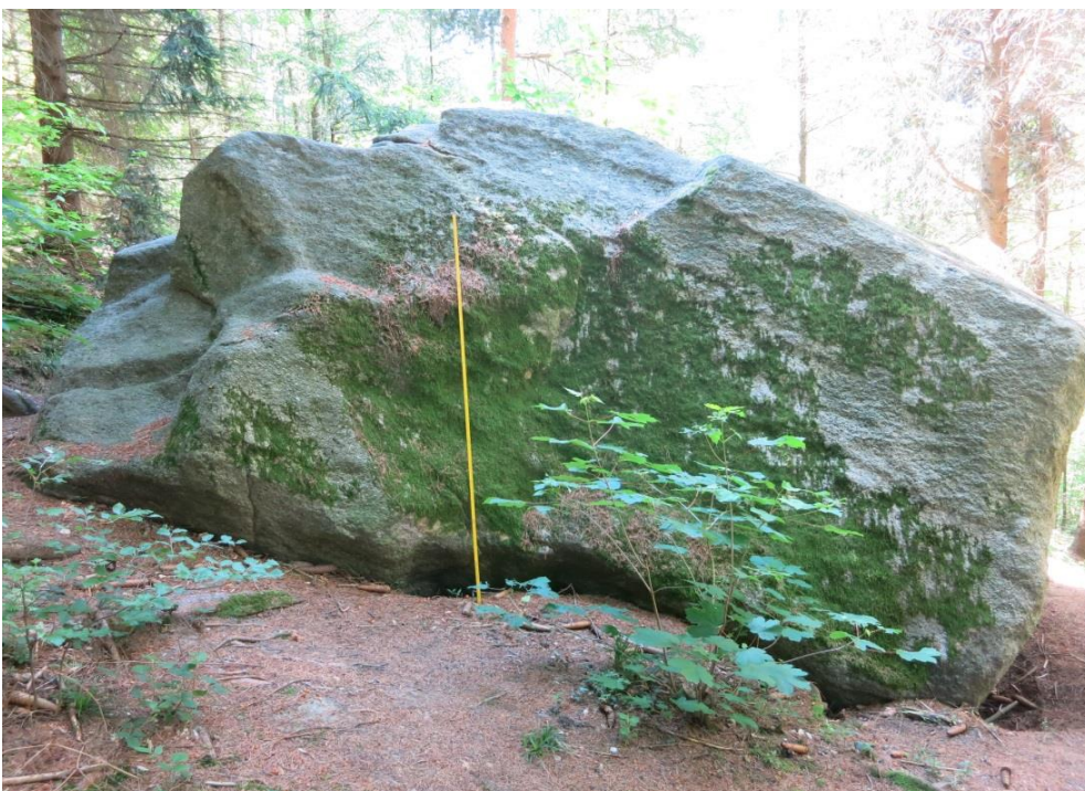
Elefantenstein mit Blick Richtung Süden (Massstab 2 m)

Bei diesem Findling handelt es sich um ein kristallines Gestein. Er zeigt eine typisch granitische Zusammensetzung mit weissem und lachsfarbenem Feldspat, hellem, durchscheinendem Quarz und schwarzem Biotit. Er ist gleichkörnig und mittelkörnig. Der Block misst 5 x 3 x 2.8 m und ist teilweise mit Moos bewachsen. Die Anwitterungsfarbe ist grau - weiss und es ist ein leichtes, bei Graniten typisches vergroben (Zerfall der einzelnen Körner zu Sand) an der Oberfläche zu erkennen. Der Findling wurde vom Reussgletscher vor rund 20'000 Jahren, während der letzten Eiszeit, der Birrfeld-Eiszeit (ehemals Würmeiszeit), in diesem Gebiet liegengelassen. Er befindet sich ganz in der Nähe der Maximalausdehnung des birrfeld-eiszeitlichen Gletschers, deshalb ist er besonders schützenswert.