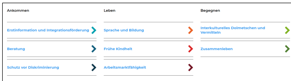
Abbildung 1: Pfeiler und Förderbereiche der KIP

Die Kantonalen Integrationsprogramme (KIP) beruhen auf drei thematischen Pfeilern – Ankommen, Leben, Begegnen – mit insgesamt acht Förderbereichen und umfassen Massnahmen der spezifischen Integrationsförderung.