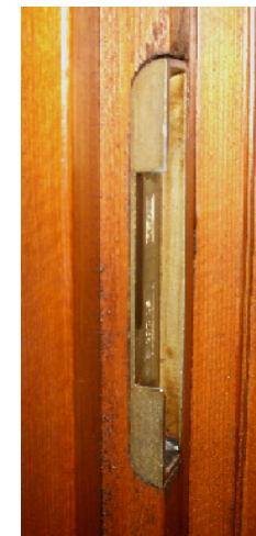
... Gegenstück (Schliessleiste) ausgehebelt werden kann