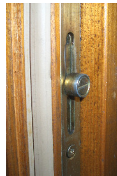
Rollzapfen, welcher leicht aus dem ....