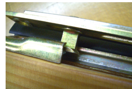
Sicherheitsverschluss - Pilzkopfzapfen in Stahlschliessstück