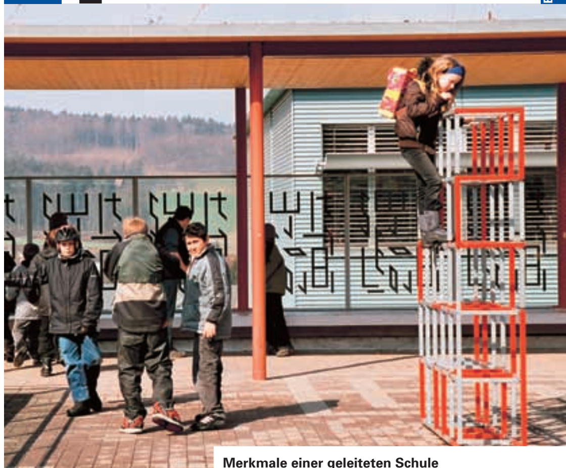
Merkmale einer geleiteten Schule an der Aargauer Volksschule

Departement Bildung, Kultur und Sport Abteilung Volksschule und Heime Bachstrasse 15 5001 Aarau Tel. 062 835 21 00 Fax 062 835 21 09 www.ag.ch/bks