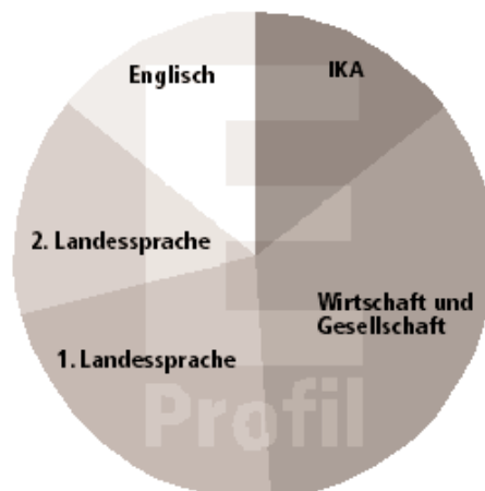
E-Profil vor allem selbstständiges Arbeiten und Planen von Prozessen