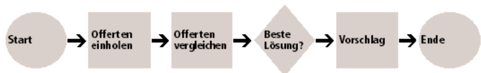
Beispiel eines Ablaufs

Parallel zur Prozesseinheit führen die Lernenden ein Lernjournal . Sie notieren darin ihre Erfahrungen, ihre positiven wie auch negativen Erlebnisse und lassen ihre Denkschritte und Erlebnisse nochmals Revue passieren. Verbesserungsvorschläge zu ihrem eigenen Verhalten dokumentieren sie ebenfalls. Aus den gewonnenen Erkenntnissen ziehen sie die Konsequenzen für ihr zukünftiges Handeln.