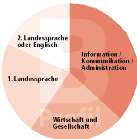
B-Profil vor allem ausführende Tätigkeiten

M-Profil . Dabei durchlaufen die Lernenden die erweiterte Grundbildung in Kombination mit den Anforderungen der kaufmännischen Berufsmaturität. Die kaufmännische Berufsmaturität kann auch im Anschluss an eine Berufslehre absolviert werden.